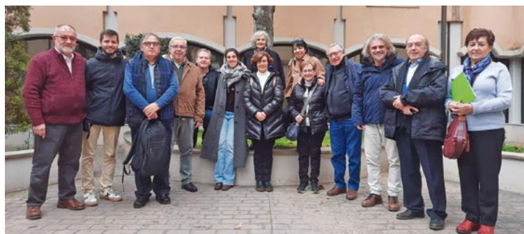
Representació de la Pastoral Penitenciària del bisbat de Sant Feliu de Llobregat

E l dissabte 2 de març passat, els preveres i una representació del voluntariat del Centre Penitenciari de Brians 1 i Brians 2, van participar a la 28a Jornada de Pastoral Penitenciària dels bisbats amb seu a Catalunya. Enguany, la Jornada de Pastoral Penitenciària de Catalunya la va organitzar el bisbat de Lleida, i es va realitzar a l'Acadèmia Mariana. Hi van assistir 65 representants.