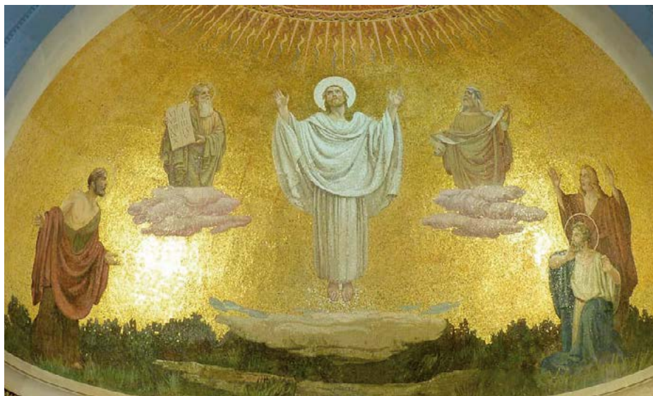
Mosaic de la Basílica de la Transfiguració de Jesús, Mont Tabor

Perquè vós sou el Senyor, / l'Altíssim sobre tota la terra, / i excels per damunt de tots els déus. R.