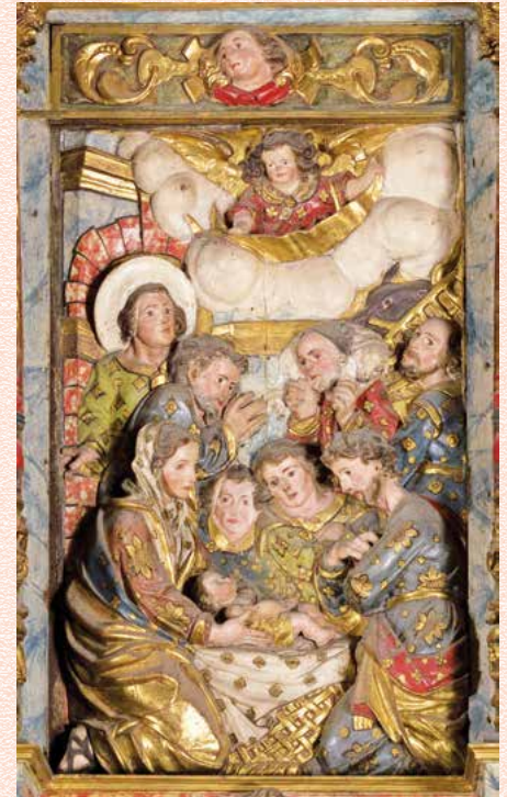
Escena del naixement del retaule major de la Parròquia de Santa Maria de la Geltrú de Vilanova i la Geltrú.

Una única veu crida en la nit, per refractar-s'hi en mil vocacions. Benaurat qui sàpiga escoltar i respondre caminant vers ella. Hi trobarà la seva llar.