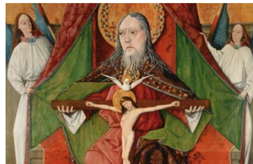
La Santíssima Trinitat (1471), Master GH. Església de la Trinitat, Mosóc (Eslovàquia)

«Déu, donant-nos l'Esperit Sant, ha vessat en els nostres cors el seu amor»