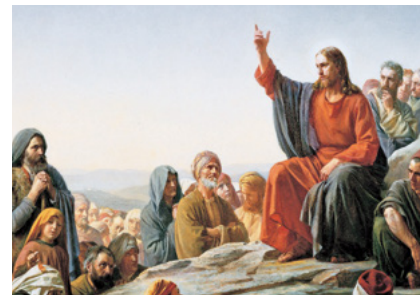
Sermó de la muntanya (1877), de Carl Heinrich Bloch