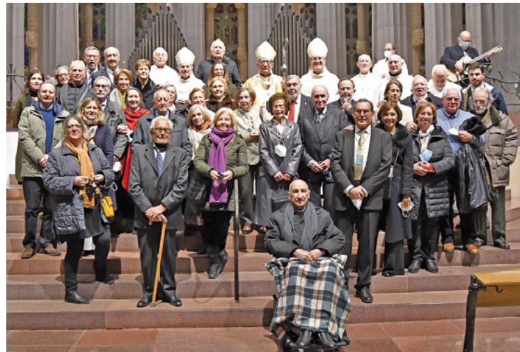
Primera comunitat de la Parròquia de les Santes Juliana i Sempronía, amb membres del 1971 i altres actuals

El 1971 quan van néixer les primeres comunitats neocatecumenals a Barcelona. Concretament, el 12 de desembre del 1971 va néixer la que