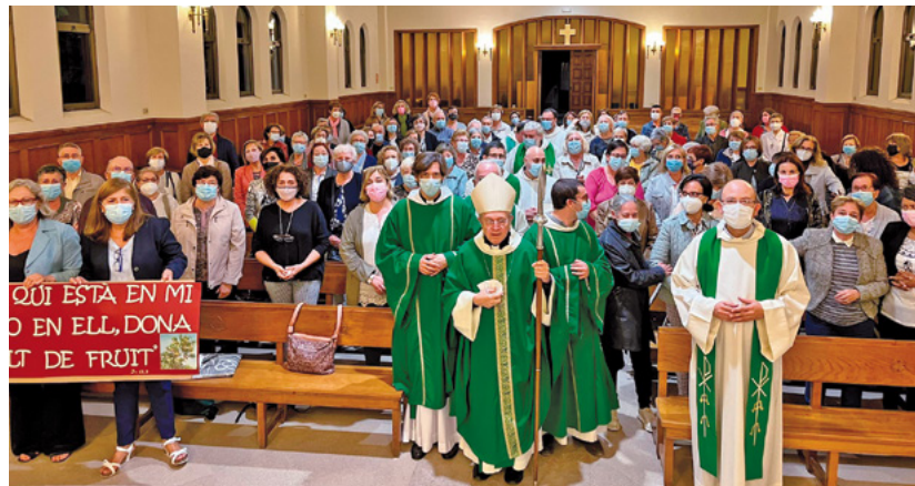
Celebració de l'enviament dels catequistes, el passat 10 d'octubre de 2021

Mons. Arthur Roche, prefecte de la Congregació per al Culte Diví i la Disciplina dels Sacraments, en una carta que acompanya la publicació de la Editio typica , dirigida als presidents de les Conferències Episcopals, proposa