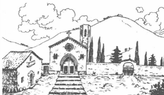
Dibuix ideal de la segona església parroquial i primera rectoria.