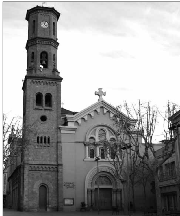
Façana actual de la catedral de Sant Llorenç

VI—, ja es plantejà la qüestió de si seria oportú fraccionar la diòcesi. Es feren consultes en alguna diòcesi d'Europa on s'havia fet, es va debatre àmpliament i, davant la constatació d'aspectes positius i de negatius, es cregué que el millor fóra no tirar endavant la partició i deixar-ho com estava.