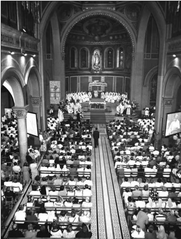
Interior de la catedral