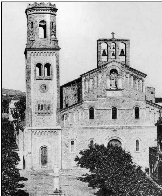
Imatge de la façana de la parròquia abans de 1936