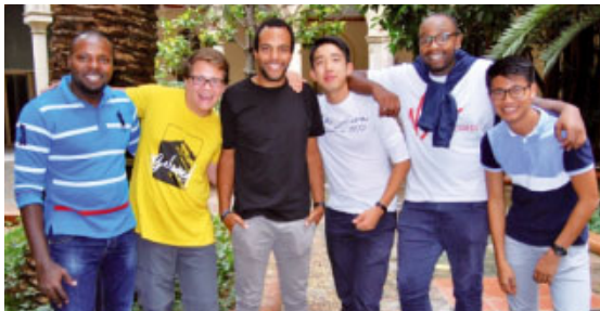
Seminaristes del curs propedèutic