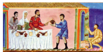
Llàtzer i Epuló, detall de la miniatura del Codex Aureus d'Echternach (1035-1040) . Museu Nacional Germànic, Nuremberg (Alemanya)

Un dels gran problemes de la riquesa és que el ric s'obsessiona amb els diners i no té ni temps ni ganes de preocupar-se dels altres i de les seves necessitats, per tant no solament deixen d'estimar Déu sinó també el proïsme. Ho veiem a les lectures d'avui. Un cop més, Amós denuncia els rics: S'estiren en llits de marfil..., mengen els anyells més tendres, improvisen al so de l'arpa, beuen vi en grans copes, s'ungeixen amb els perfums . Però el pitjor és que no els fa cap pena el desastre de les tribus de Josep , és a dir, no es preocupen del poble i es creuen segurs en la seva riquesa quan dins de pocs anys caurà el desastre sobre tots ells. Però als rics això no els preocupa. I això que també ells rebran el càstig: Serán els primers en les files dels deportats; així s'acabarà l'orgia dels vividors .