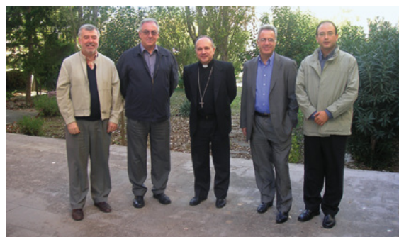
Primer consell episcopal. 21 d'octubre de 2004

del Consell Episcopal, l'equip del vicari general, vicaris territorials i secretari general que col·laboren en primera instància amb el Bisbe en el govern de la diòcesi. Aquí teniu una retrospectiva fotogràfica, amb les imatges del primer consell episcopal i l'actual, que recull les variacions que han tingut lloc en aquests 16 anys i 500 reunions.