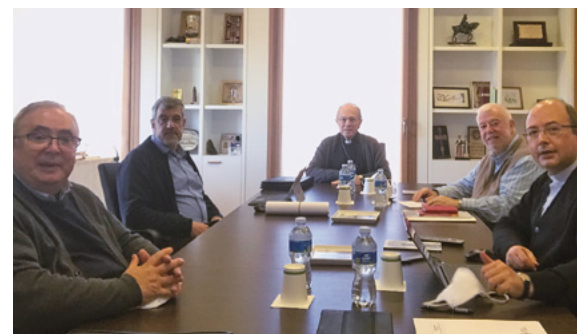
Consell episcopal núm. 500. 23 d'octubre de 2020