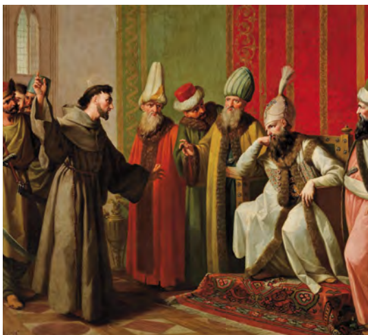
Sant Francesc davant el sultà d'Egipte Melik-el-Kamil, de Zacarías González Velázquez, al Museu del Prado

Aquest llibre i aquesta escena en concret, em van impressionar quan el vaig llegir per primera vegada fa anys. La meua impressió responia a una inquietud que llavors despertava en mi grans inter-