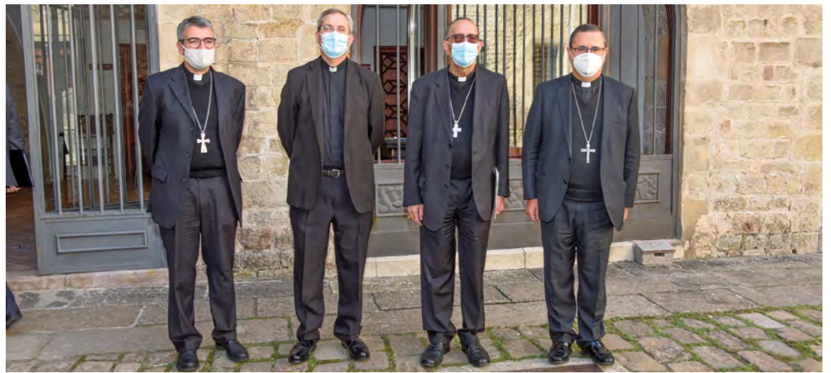
El nou bisbe auxiliar electe —sense la creu pectoral—, amb el cardenal i els altres bisbes auxiliars