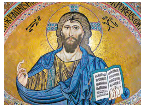
Mosaic de Crist Pantocràtor (s. XII). Catedral de Cefalù, Sicília (Itàlia)

Tots sabem que sovint l'adulació amaga altres intencions. Ho veiem a l'evangeli: Mestre, sabem que dieu sempre la veritat i que ensenyeu de debò els camins de Déu, sense mirament per ningú, sigui qui sigui, ja que no obreu per complaure els homes. No és un elogi, sinó una trampa: Planejaren sorprendre Jesús en alguna paraula comprometedora. Però no deixen de ser molta veritat aquestes paraules sobre Jesús: Diu sempre la veritat de Déu, no buscant el que agrada els homes sinó proclamant el que Déu vol. I llavors plantegen la pregunta trampa: És lícit o no, de pagar tribut al Cèsar? Si diu que no, llavors l'acusaran de rebel contra els romans; però si diu que sí el podran titllar de col·laborador amb els opressors, el odiats romans. A més, entre els jueus hi havia partidaris del sí i del no. Però, com sempre, Jesús se'n surt per un camí inesperat: Cal donar a Déu el que és de Déu, que sempre és el primer i el més important; ell és l'únic Senyor; al Cèsar allò que és del Cèsar: les autoritats poden recaptar diners al servei de tot el poble perquè la seva missió és vetllar pel bé dels seus ciutadans i per això necessiten també els impostos. Però el seu poder no és absolut, ha de ser relativitzat perquè només hi ha un Senyor.