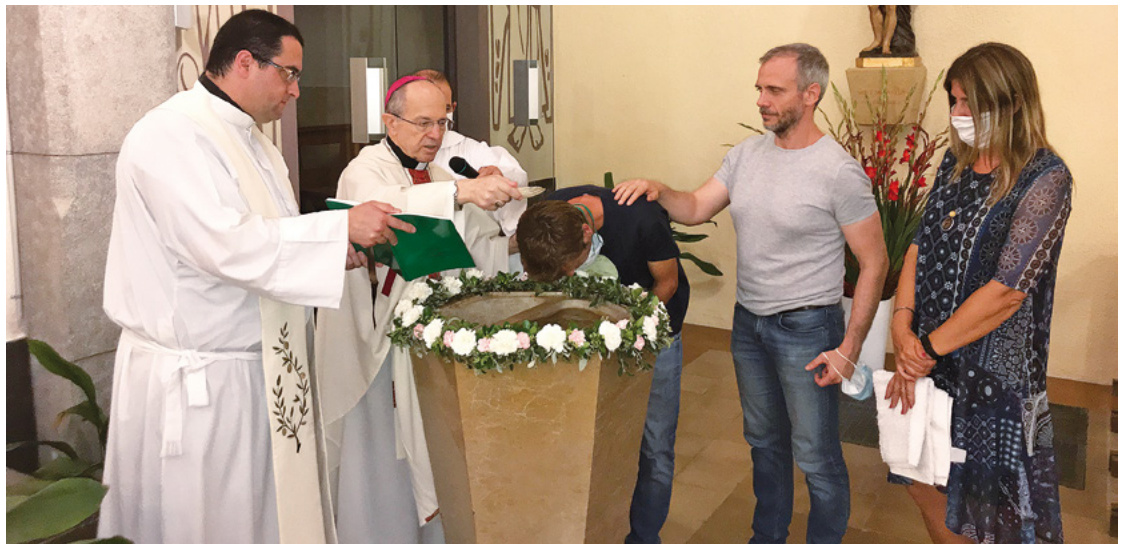
Baptisme de l'Hèctor

M'apropro a Déu des de la necessitat de viure la meua experiència vital des de la pau interior i espiritual. I des de la intuïció que aquest anhel només serà assolit en la mesura en la qual sigui capaç de transcendir la simple individualitat aïllada per tal d'entendre'm i explicar-me a partir de realitats eternes, històriques i atemporals que m'acompanyen, em conformen i em superen, però que, alhora, es manifesten en la nostra quotidianitat en la més ab-