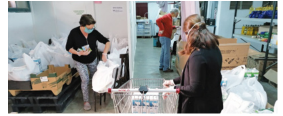
Banc d'aliments a Sant Sadurn d'Anoia

A vui festa de Corpus Christi, Dia de la Caritat, culmina la Setmana de la Caritat, marcada enguany inevitablement pels profunds efectes socials, sanitaris i econòmics de la pandèmia del coronavirus, pels quals, des del minut zero, Càritas s'ha bolcat a prestar acompanyament d'emergència a milers de persones afectades.