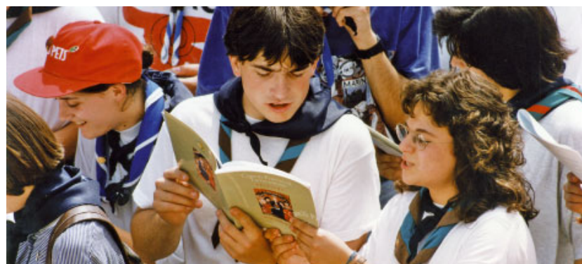
Joves participant en l'acte de cloenda del Concili a l'amfiteatre romà de Tarragona el dia 4 de juny de 1995