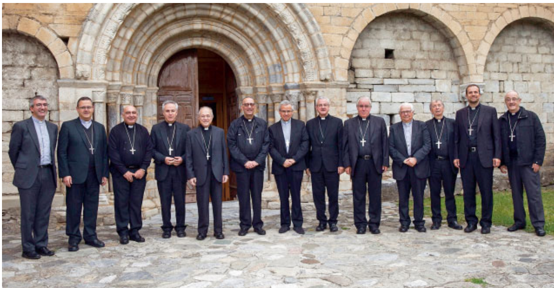
Els actuals bisbes de les diòcesis amb seu a Catalunya en una imatge de la reunió de la Tarraconense celebrada a Salardú, el passat mes de juliol

El concili fou clausurat solemnement a la catedral de Tarragona el 4 de juny de 1995. En compli-