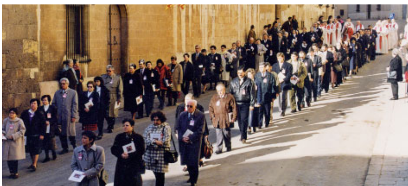
Processó pels carrers de Tarragona. La participació de laics va ser molt important i generosa