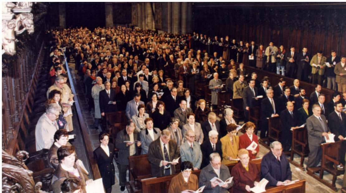
Imatge de la inauguració del Concili Provincial Tarraconense que va tenir lloc el 21 de gener de 1995, a la Catedral Basílica Metropolitana i Primada de Santa Tecla