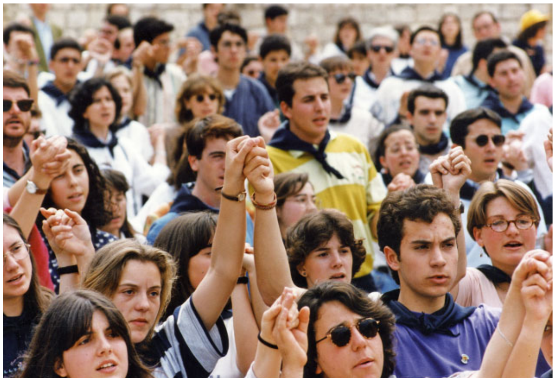
Un grup de joves participa a l'acte de cloenda del Concili Provincial Tarragonense, celebrat el 4 de juny de 1995

Contemplant els seus documents i resolucions, hom s'adona de la seva profunda actualitat. A la llum de l'Evangelí i de l'escolta de la Paraula de Déu, anunciar l'Evangelí a la nostra societat, amb una sol·licitud especial pels pobres, i en un marc d'unitat pastoral de les nostres Esglésies, ha de ser el pernil o el pal de paeller de l'Església d'avui. Per aquest motiu, ens trobem en plena fase de recepció del Concili Provincial de 1995. Amb les degudes condicions d'universalitat de temps i d'espai, la recepció ha d'anar originant un veritable « consensus fidelium »,