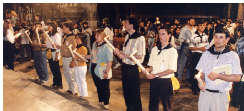
Moment de la cloenda del Concili a l'interior de la Catedral de Tarragona