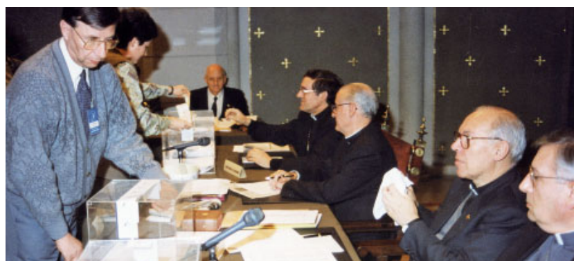
Obertura de les urnes després de les votacions dels temes