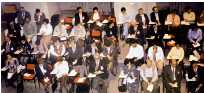
Sessions de treball al Casal Borja de Sant Cugat del Vallès