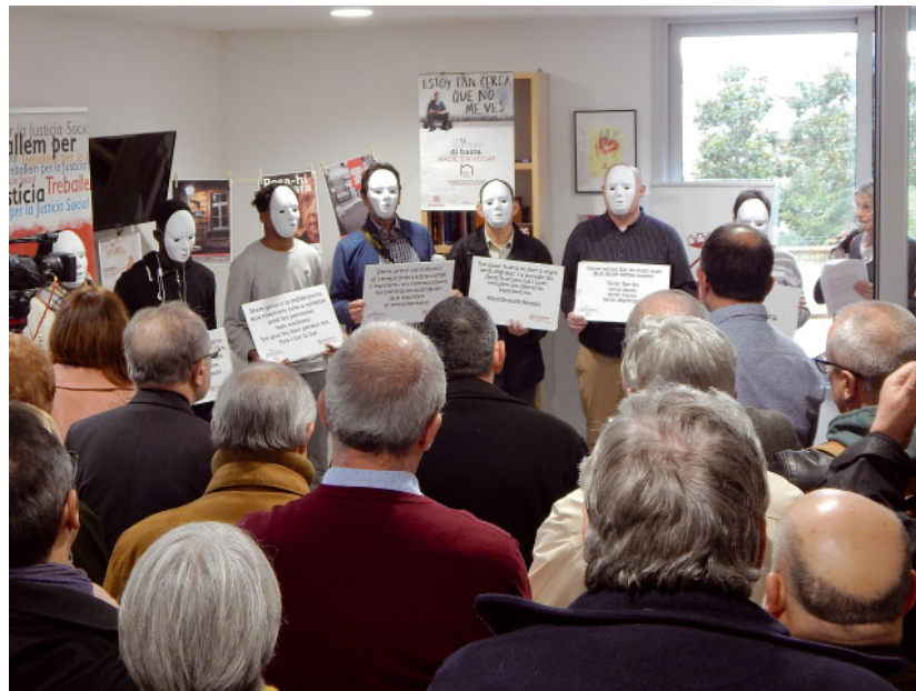
Performance «Posa-hi cara»

Ja fa molts anys que des de Càritas es reivindica que es garanteixi un dret tant bàsic per a les persones com