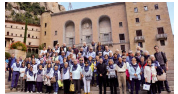
Alguns dels participants a la trobada