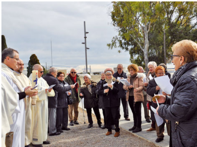
Benedicció de les candeles a l'exterior de l'ermita