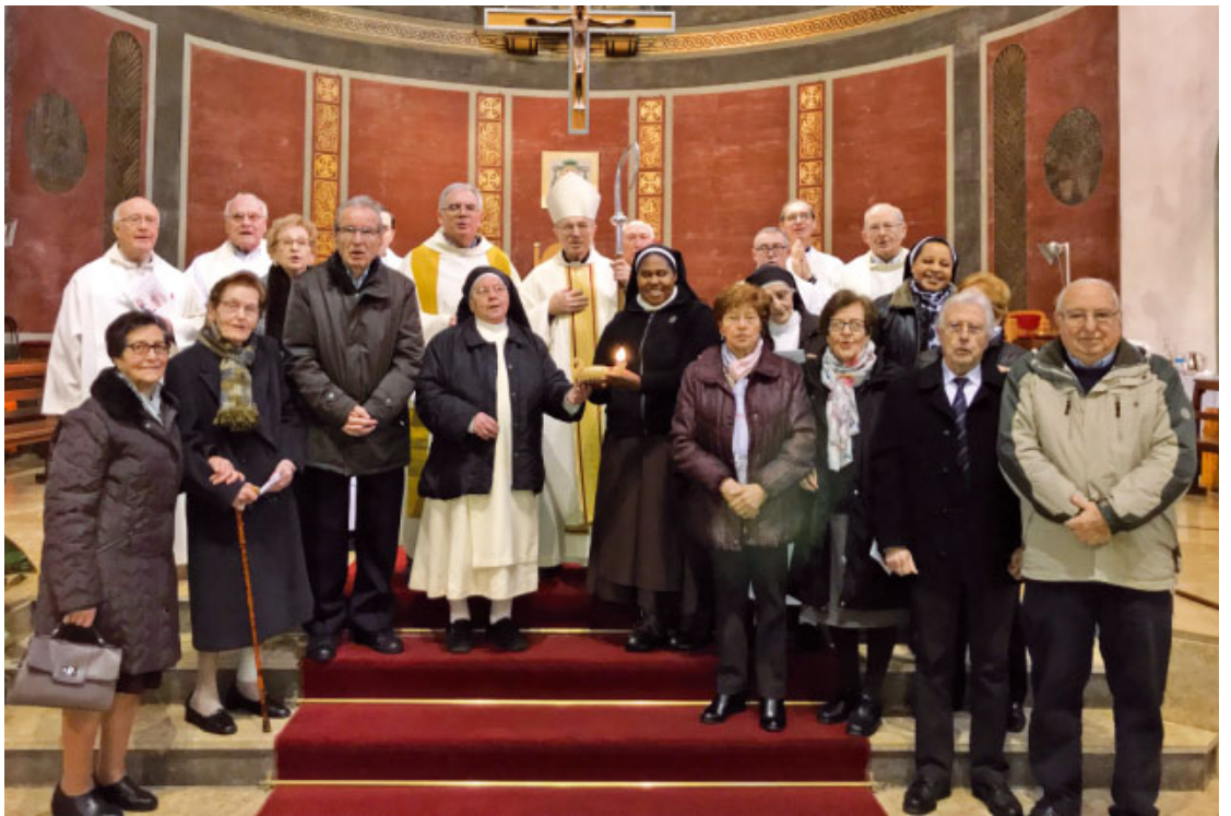
Alguns religiosos, religioses i membres de Vida Creixent, al final de l'eucaristia