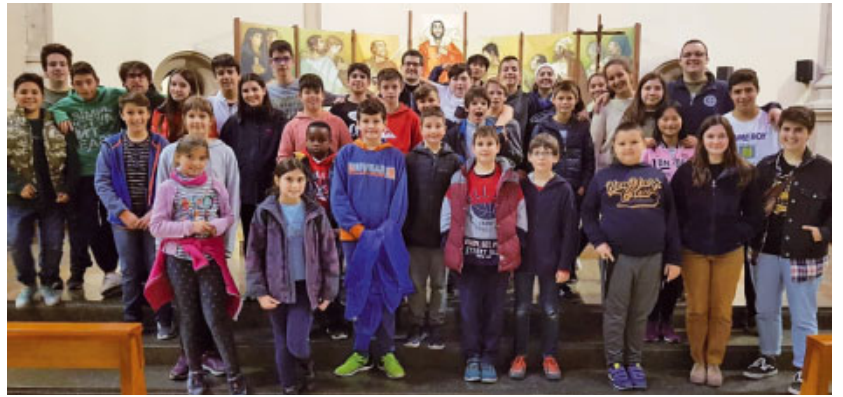
Participants de la Diòcesi de Sant Feliu de Llobregat

Aquest ha estat el títol de la XXVI Jornada d'escolans, que va aplegar 96 infants de les diòcesis de Barcelona i Sant Feliu que ajuden com a escolans a les seves parròquies.