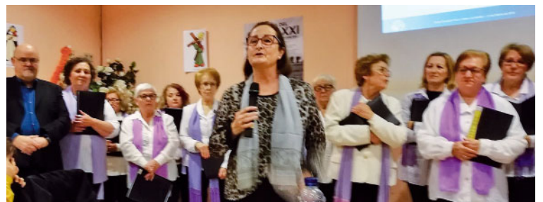
Sopar solidari a Castelldefels

de Mans Unides que es fan en aquell país de l'Àfrica i també va explicar el projecte d'enguany a la Guajira.