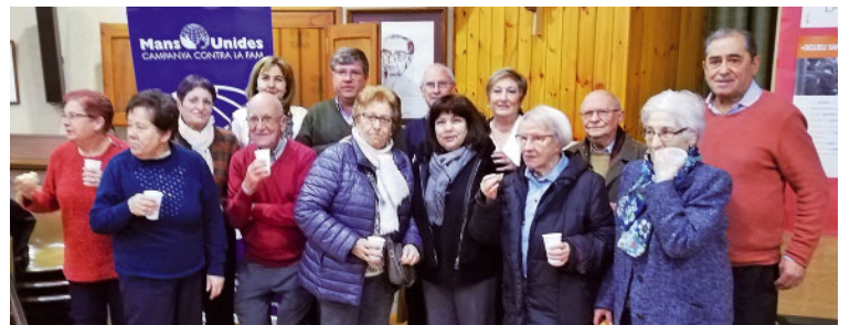
Sopar solidari a Vilafranca del Penedès