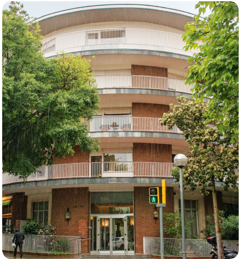
Façana de la Residència Sacerdotal Sant Josep Oriol

He tingut l'oportunitat de visitar-los i he pogut comprovar l'escalf que reben i l'ambient fratern que gaudeixen els membres d'aquesta comunitat sacerdotal. Demano a Déu que intercedeixi per-