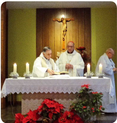
El cardenal Omella celebrant l'Eucaristia a la Residència Sacerdotal

Card. Joan Josep Omella, arquebisbe de Barcelona