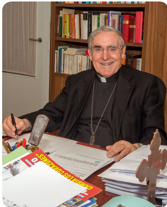
El cardenal Lluís Martínez Sistach al seu despatx de la Residència Sacerdotal Sant Josep Oriol

La Residència gaudeix de molt bon clima sacerdotal i comunitari. Ens coneixem tots i ens estimem tots. Ofereix als sacerdots l'habitatge i la cura de totes les seves necessitats materials, espirituals i formatives. Els sacerdots gaudeixen de plena llibertat per sortir i entrar, realitzant tots els que poden diversos serveis religiosos i pastorals en la catedral i en les parròquies de la ciutat i també en les de Iluny de la ciutat. Penso que la configuració de la Residència Sacerdotal ha de permetre i ha de facilitar que els sacerdots puguin realitzar alguns serveis pastorals, mantenint les re-