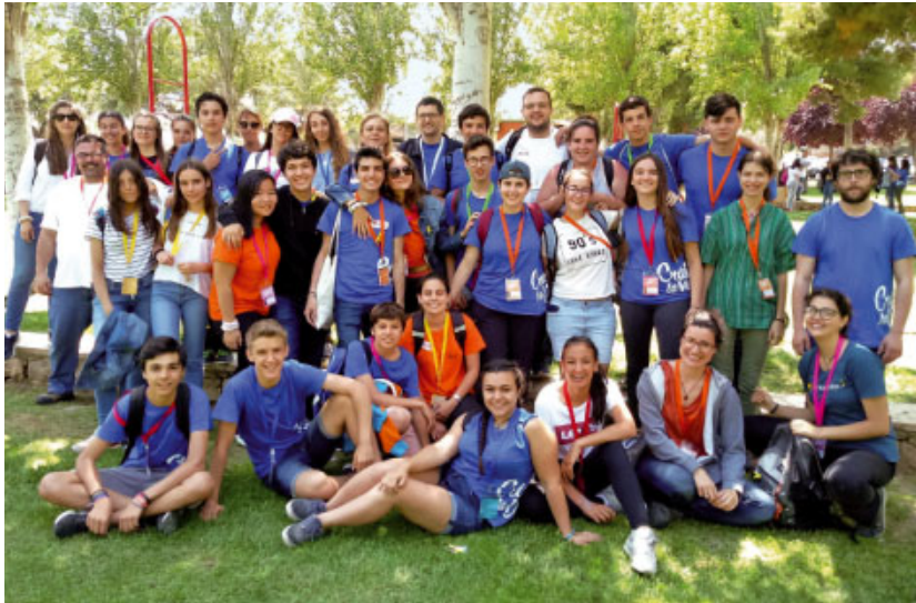
Gairebé un centenar de joves del Bisbat de Sant Feliu de Llobregat van participar a l'Aplec. A la foto, un grup dels qui van assistir-hi tot el cap de setmana

La participació activa de tots els joves, voluntaris, animadors que acompanyen grups, etc., va fer que hi hagués un clima excepcional i es respirés en tot moment l'alegria de ser creient.