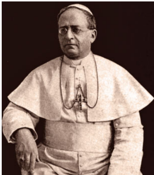
Pius XI, autor de l'encíclica Mit brennender sorge

Per una sèrie de circumstàncies he tornat a la lectura de l'encíclica Mit brennender sorge , que el 1939 va publicar el papa Pius XI contra el règim nazi. L'argument central d'aquest document és que resulta absolutament inacceptable qualsevol règim polític que no sigui fidel a uns principis bàsics de moral. En el llenguatge del pontífex