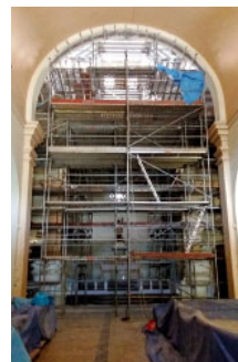
Església de Sant Joan Baptista

puntuals i menors de la Generalitat de Catalunya i la Diputació de Barcelona i, sobretot, amb l'esforç del bisbat, a través del seu departament d'Administració Econòmica, i de la Parròquia, demanant préstecs per poder assumir les despeses d'aquest projecte, imprescindible per a l'ús del temple.