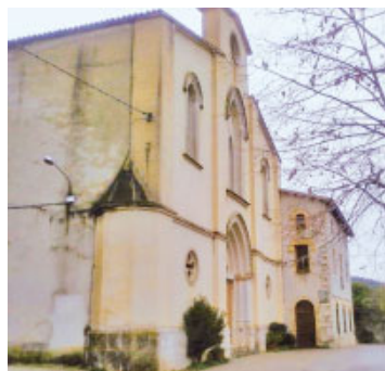
Parròquia de Sant Esteve d'Ordal

El proper 26 de juliol, al matí, es farà present al casal d'estiu de l'Esplai Sol Naixent d'Ordal.