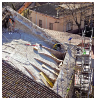
Temple parroquial de Sant Baldiri

Un exemple és la rehabilitació de la teulada del temple parroquial de Sant Baldiri, a Sant Boi de Llobregat, que estava malmesa. El projecte consta de tres fases que en ordre de prioritats són: la rehabilitació de la coberta del Santíssim, la de la nau central i per últim la de les capelles laterals. Per realitzar aquestes obres s'ha comptat amb ajudes