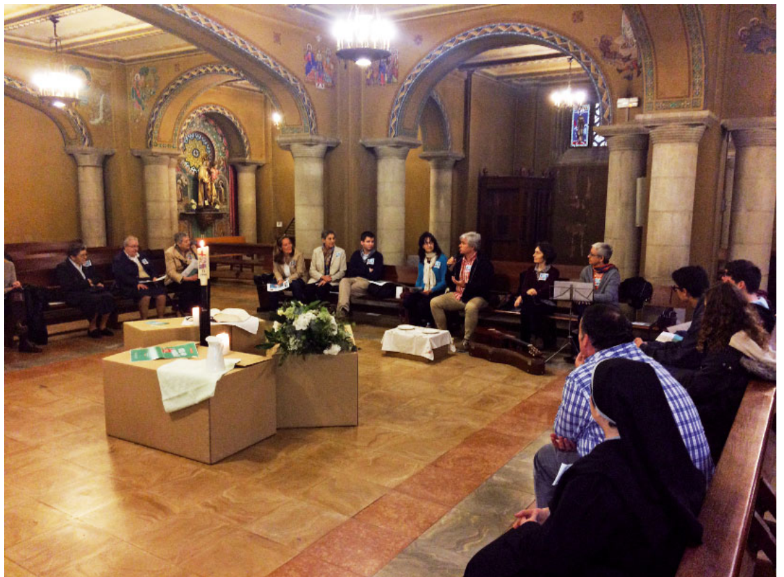
Trobada de l'any passat a la parròquia de Sant Pere i Sant Pau del Prat de Llobregat

La trobada començarà amb un moment d'acollida, benvinguda i pregària, per continuar després amb una xerrada sobre el significat de ser batejats i un treball en grups per aprofundir aquesta temàtica en primera persona. Acabarà amb un sopar plegats, que vol afavorir un clima de cordialitat i d'amistat que permeti créixer la relació i la coneixença entre els joves dels diversos indrets que participin.