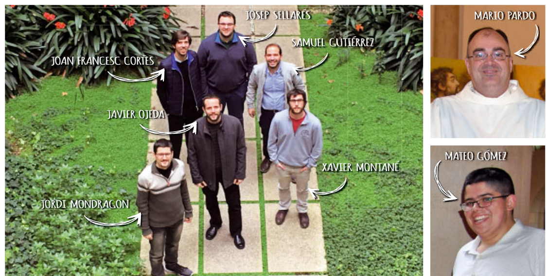
Heus aquí els vuit seminaristes de la diòcesi de Sant Feliu de Llobregat

És una impressió inicial, però després t'adones que escollir implica renunciar. Descobrir que el més fonamental és un do constant, revela com a absurd voler posseir-ho. Déu m'ha fet veure que el meu gust és caduc, mentre que la seva voluntat perdura; i això és signe de la seva misericòrdia. «Quan eres jove [...] anaves on volies, però quan siguis vell [...] un altre et cenyirà per portarte allà on no vols» (cf. Jn 21, 18).