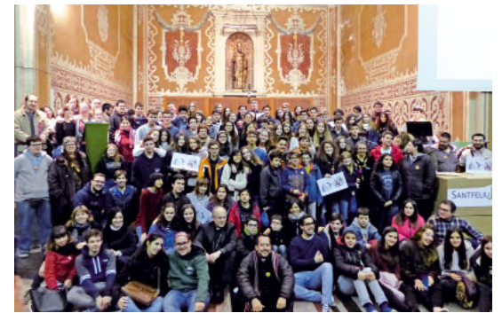
Un centenar de joves es va aplegar a Sant Sadurní

Aquesta trobada és sempre un moment de visibilitat del jovent de la diòcesi, però el que realment importa és el camí que el jove realitza al grup de la parròquia, catequesi, esplai... i que l'ajuda a inserir-se a una parròquia o comunitat concreta. Per això, la Comunitat d'Acompanyants s'ofereix per donar un cop de mà als catequistes i animadors d'adolescents i joves. Us podeu posar en contacte amb ells a santfeliujove@bisbatsantfeliu.cat .